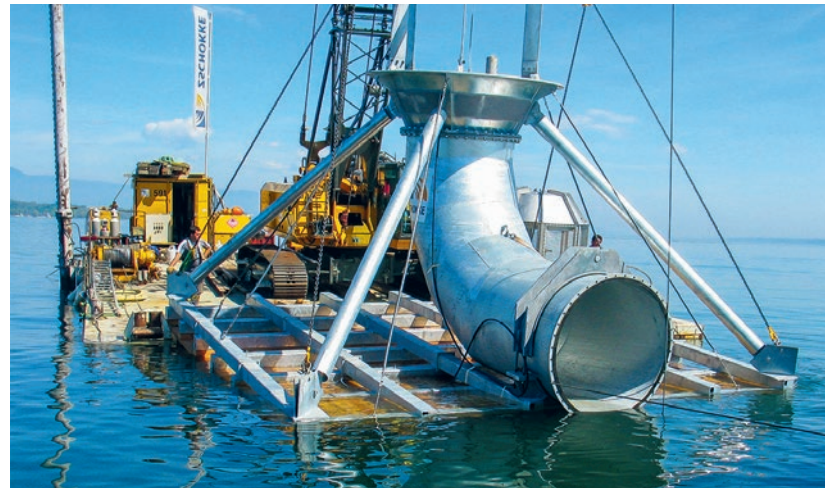
Services Industriels de Genève

Wie der Rüssel eines Ungeheuers lauert das Rohr am dunklen Grund des Genfersees. In 40 Metern Tiefe saugt es Wasser an, das durch einen Wärmetauscher zirkuliert und wieder zurückfließt. Anstatt mit Heizöl oder