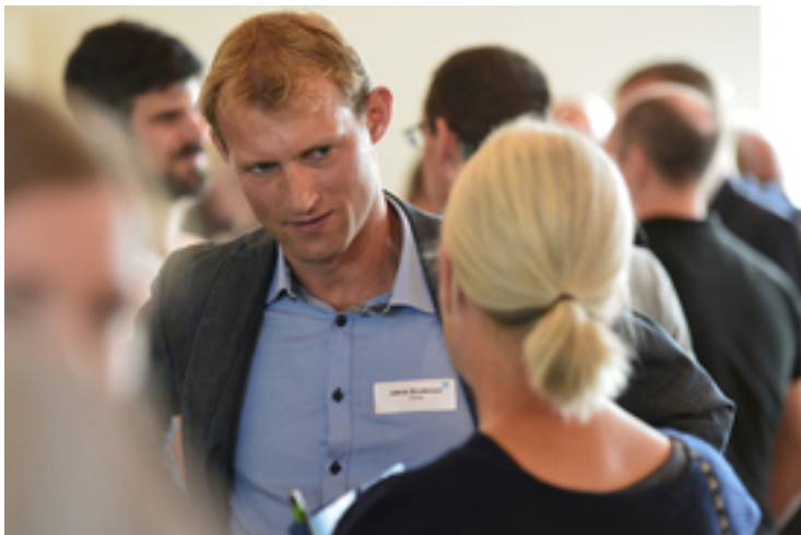
Abb. 5: Den Austausch zwischen Forschenden und den Fachleuten in der Praxis zu pflegen, ist einer der Beweggründe der Eawag, den jährlichen Infotag zu organisieren.