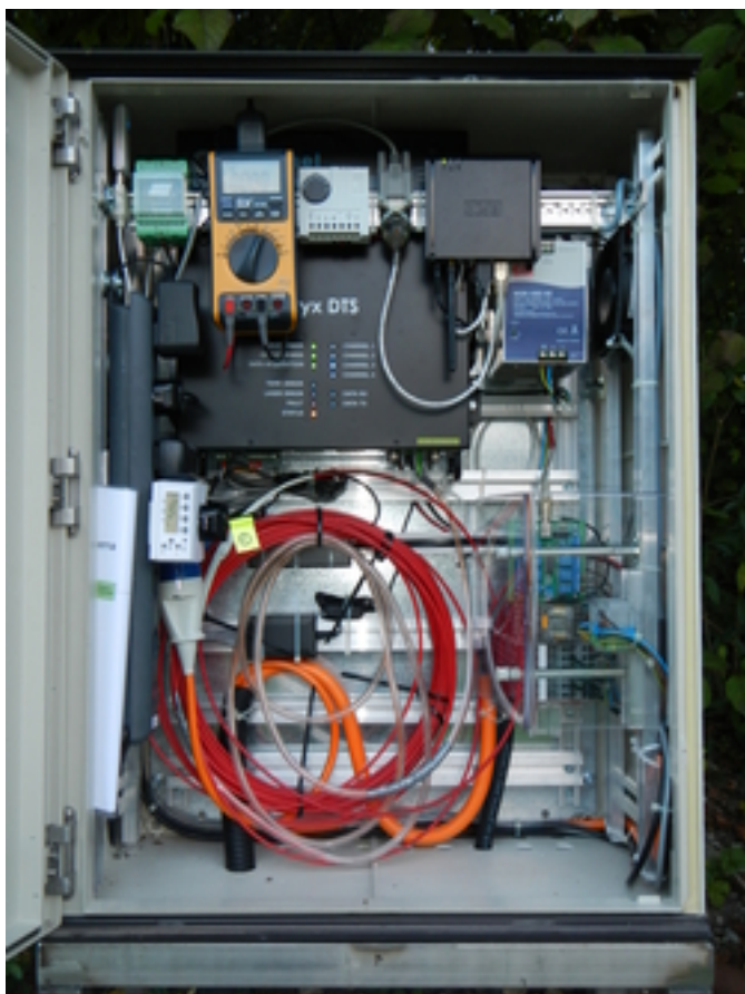
Messapparatur für den Feldversuch am Chriesbach.

Für die Studie im Chriesbach wurde ein Glasfaserkabel 40 Zentimeter tief im Flussbett vergraben. Dabei kam ein speziell konstruierter Pflug zum Einsatz [Abb. 2]. Nach Abschluss der Revitalisierungsarbeiten führte Kurth dann im Sommer 2014 aktive und passive DTS-Messungen durch [Abb. 1 und 3]. Diese Versuchsanordnung sei zwar aufwändig und vergleichsweise teuer, räumt die Forscherin ein, doch sie weise einen grossen Vorteil auf: Die Messanlage bleibe auch bei Hochwasser unbeschädigt, wodurch Langzeitmessungen möglich würden.