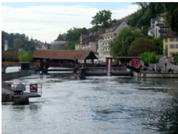
Wehr und Kraftwerksanlage am Luzerner