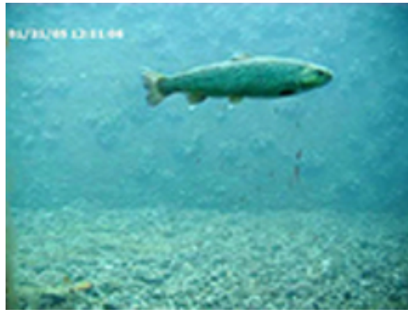
Fischpass (A. Peter)