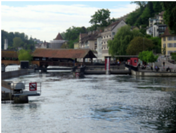
Wehr und Kraftwerksanlage am Luzerner