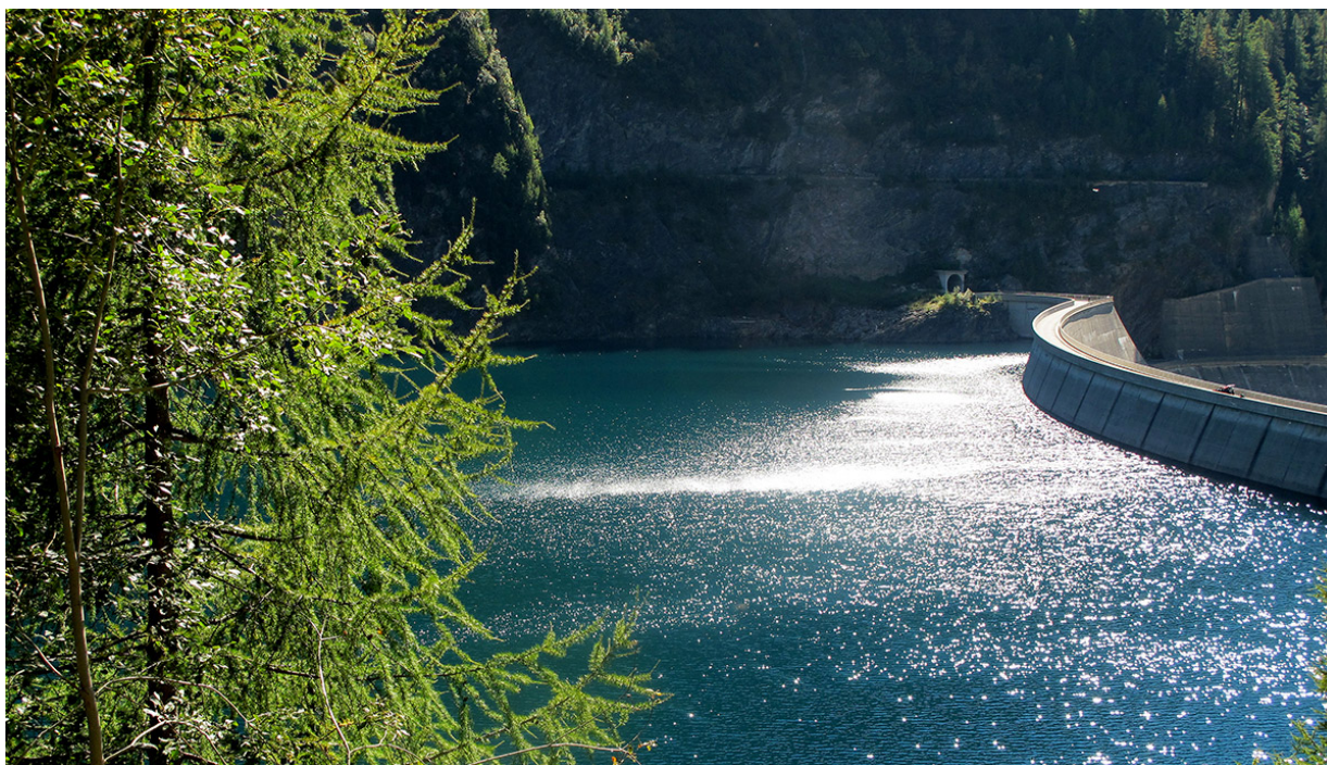
Staudamm Lago di Luzzone.