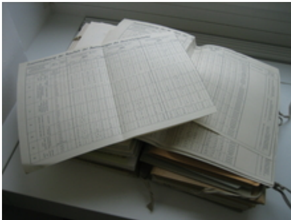
Historische Daten zur Sauerstoffkonzentration, gemessen in einem Grundwasserpumpwerk.