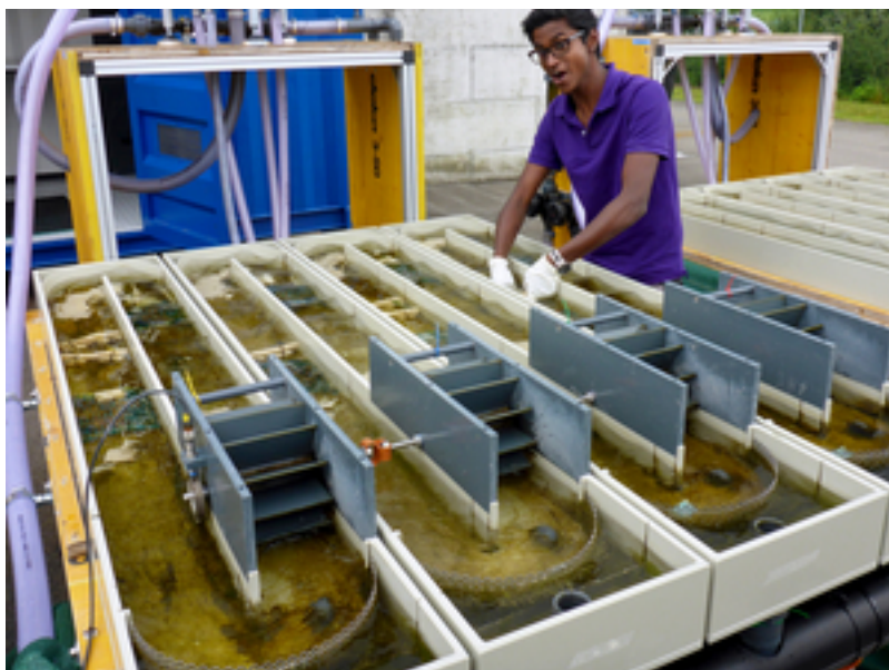
Abb. 4: Mit einem Rinnensystem bestehend aus 16 Durchflussrinnen untersuchen die Forschenden die Wirkungen einzelner Abwasserkomponenten.