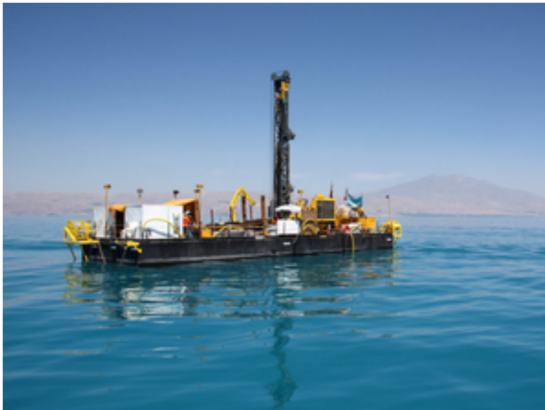
Bohrplattform auf dem Vansee (2010). Im Hintergrund der 4058 m hohe Vulkan Süphan.