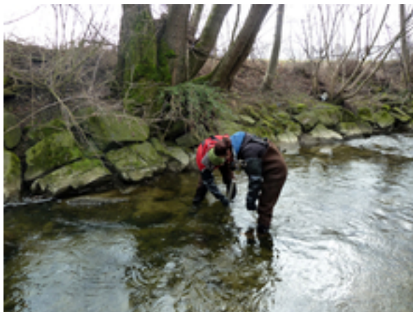
Probenahme an der Salmsacher Aach.

Anzahl gefundener Herbizide, Fungizide und Insektizide pro Untersuchungsstation (als Pflanzenschutzmittel sowie doppelt, als Pflanzenschutzmittel und Biozid zugelassene Wirkstoffe).