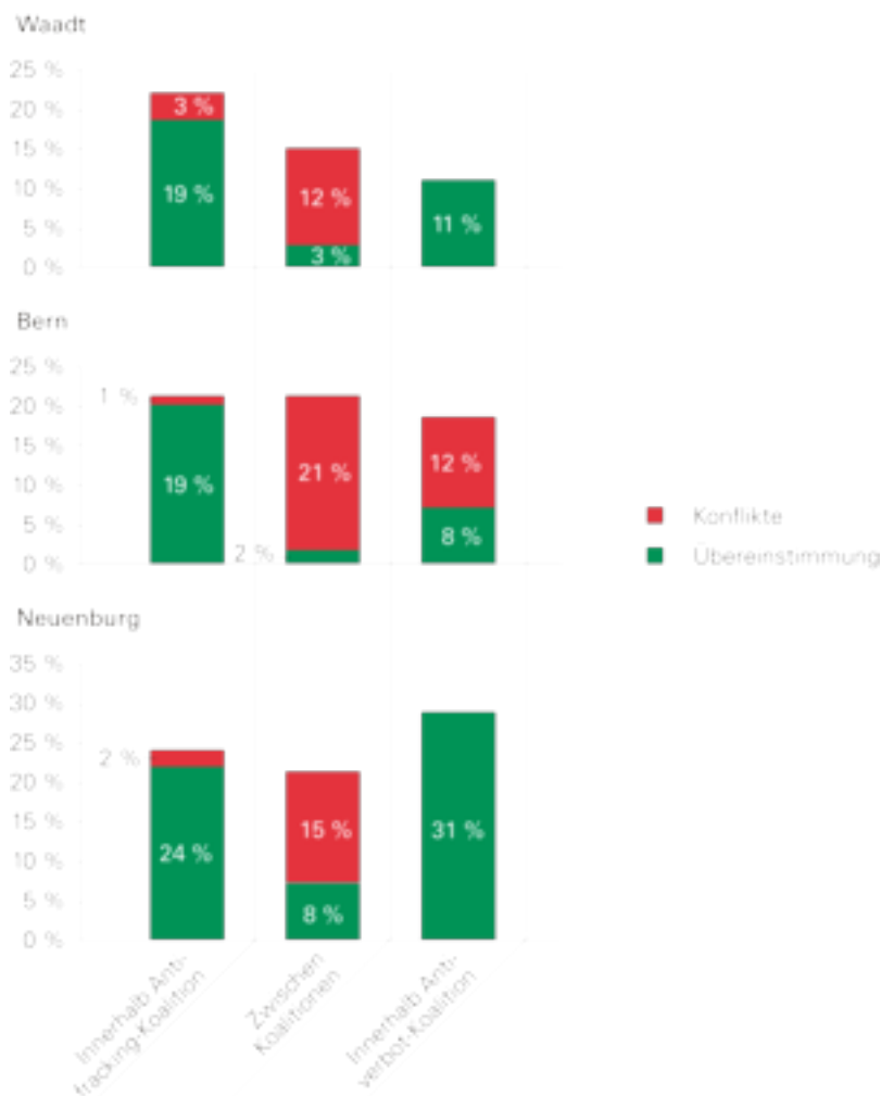
Abb. 4: Durchschnittswerte für die Übereinstimmung (grün) und Konflikte (rot) innerhalb und zwischen den Koalitionen. Lesebeispiel: Innerhalb der Antifracking-Koalition im Kanton Neuenburg beträgt die Übereinstimmung 24 Prozent, die Konflikte machen 2 Prozent aus. 100 Prozent wären erreicht, wenn sämtliche Akteure innerhalb dieser Koalition angegeben hätten, mit allen anderen Akteuren innerhalb der Koalition übereinstimmende Positionen zu haben