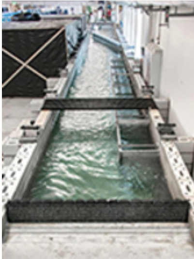
Versuchskanal der ETH Hönggerberg