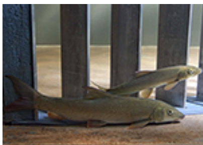
Fische von den Turbinen fernhalten

In Modellversuchen an der VAW wird – teilweise mit lebenden Fischen – zurzeit untersucht, wie die Fische mit speziellen Rechen „umgeleitet“ werden können. Die ersten Resultate sind erfolgversprechend. Ähnliche Lösungen werden im realen Massstab in den USA bereits eingesetzt. Doch sie können nicht einfach auf die mitteleuropäischen Verhältnisse übertragen werden. Dortige Flüsse führen weniger Schwemmholz und Kiesfrachten mit sich. Einige Anlagen sind auch um ein vielfaches größer und haben andere Fallhöhen. Vor allem aber konzentrieren sich in den USA die Massnahmen auf wirtschaftlich interessante Wanderfische wie die Lachse; ortsansässige Arten werden weniger berücksichtigt. Im Gegensatz dazu verfolgt die Schweiz mit dem aktuellen Gewässerschutzgesetz einen viel weitergehenden Anspruch: „Wir sind bestrebt, den Fischabstieg für möglichst alle Arten zu ermöglichen. Das ist eine weitaus grössere Herausforderung, da jeder Fisch individuelle Verhaltensweisen zeigt“, erklärt Fischbiologe Dr. Armin Peter von der Eawag.