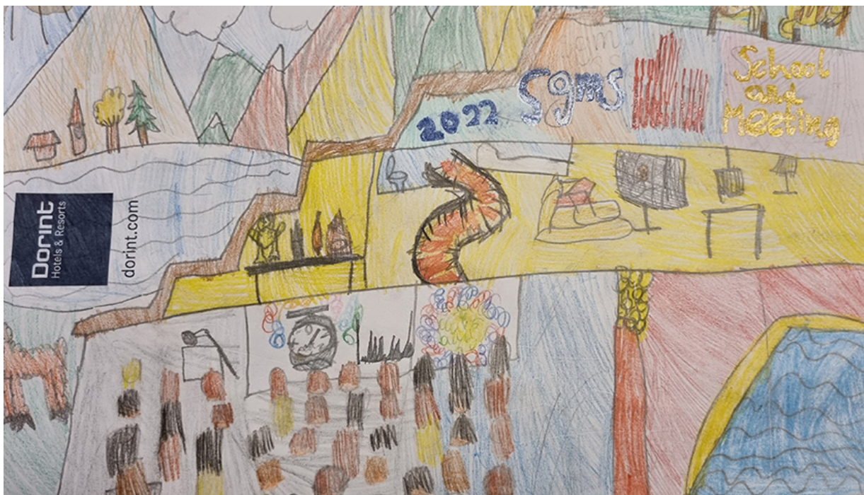
SGMS 2022 Preis für die beste Zeichnung für Agafia Groh