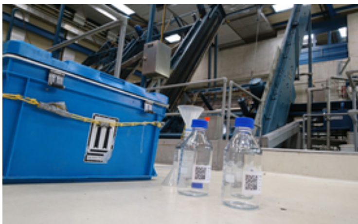
Probenahmen auf der Zürcher Kläranlage Werdhölzli.