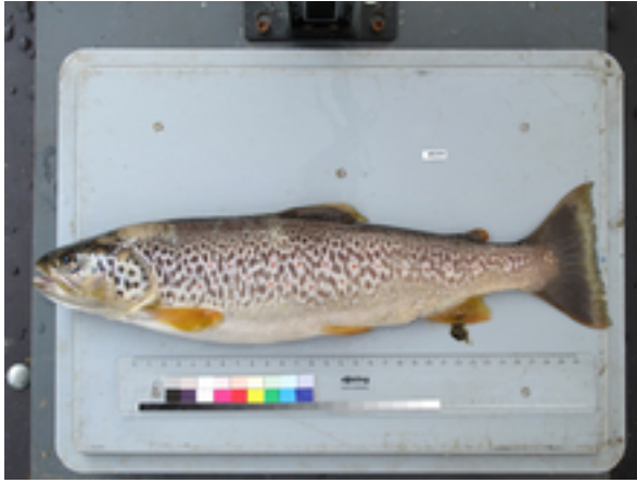
Vom Aussterben bedrohte Marmorforelle aus dem Lago di Poschiavo.