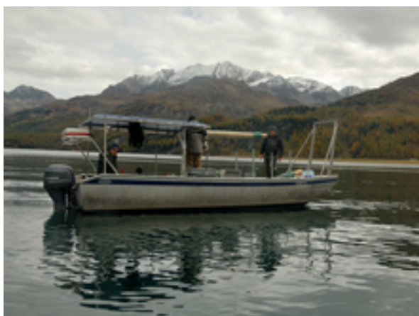
Probenahmen auf dem Silsersee.