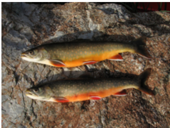
Nicht einheimische Seesaiblinge aus dem Silsersee.