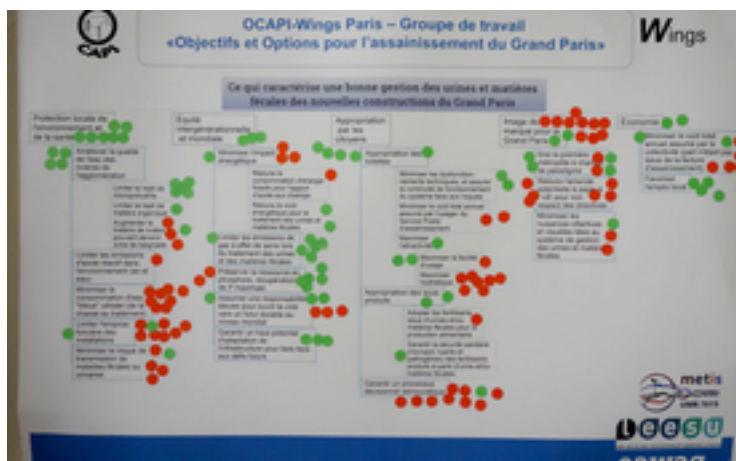
Was eine gute Urin- und Fäkalienentsorgung bei Neubauten im Grossraum Paris auszeichnet. Die roten und grünen Punkte bedeuten aus Sicht der am Workshop teilnehmenden Fachpersonen, dass das jeweilige Ziel besonders wichtig bzw. eher unwichtig ist.