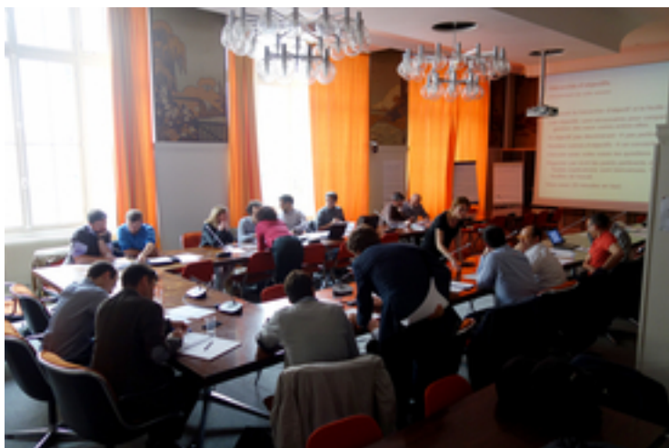
In einem Workshop in Paris erarbeiteten lokale Fachleute zusammen mit Eawag-Forschenden Ziele und Optionen für die Sanierung der Abwasserinfrastruktur – den Input für die ValueDecisions-App.

In der Forschungspraxis hat sich ValueDecisions bereits mehrfach bewährt. So untersuchte Lienerts Gruppe, wie sich das Abwasser in der Region Paris künftig am besten reinigen liesse. Die bestehende, grosse Kläranlage erreicht ihre Kapazitätsgrenzen, weil die Bevölkerung ständig wächst und der Klimawandel die Verdünnung des Klärwassers erschwert. «Wir wurden angefragt, ob man alternative Abwasserreinigungsmethoden in Betracht ziehen kann», erzählt Lienert. In einem Workshop mit lokalen Fachleuten wurden Umweltziele sowie sozioökonomische Ziele aufgestellt und in der Folge fünf Optionen ausgewählt, darunter dezentrale Optionen mit Urin- und Fäkalienseparation sowie Trockentoiletten. Diese Auswahl bildete die Grundlage für eine Umfrage bei 655 Personen aus der Region, die ihre Wünsche und Präferenzen angeben konnten.