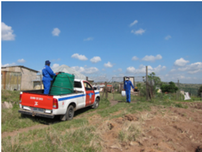
Abb. 4: Mitarbeiter von Durban