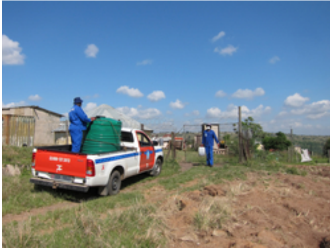
Abb. 4: Mitarbeiter von Durban