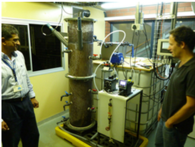
Abb. 6: Pilotanlage im Kundenzentrum

Die Urinseparierung eignet sich aber nicht nur für Trockensysteme wie in Durban. Sie bringt auch an Orten mit wassergespülten Toiletten, Kanalisationsnetzen und Abwasserreinigung Vorteile: Sie entlastet die Kläranlagen bei der Elimination von Nährstoffen aus dem Abwasser.