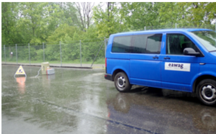
Beprobung des Abwasserüberlaufs bei Niederschlag in einer Kläranlage in Münchwilen, Thurgau, Schweiz.

dem wir die Kontamination mit Antibiotikaresistenzen bei Unwettern im Fluss Murg bei Münchwilen in der Schweiz untersuchen.