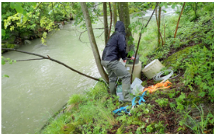
Einsatz eines automatischen Probenehmers im Abwassereinzugsgebiet bei Regenwasserereignissen.

Wir waren überrascht, dass der erhöhte Gehalt an Antibiotikaresistenzgenen im Fluss noch eine ganze Weile (22 Stunden) anhielt, selbst nachdem der Sturm abgezogen war. Zwar gibt es entlang des Flusses keine weiteren Kläranlagen, doch flussaufwärts gibt es viele Einleitungsstellen, an denen Mischwasserüberläufe den Fluss verunreinigen können. Dies bedeutet, dass mit Antibiotikaresistenzen kontaminiertes Abwasser an verschiedenen Stellen in den Fluss gelangt ist und die Einträge flussabwärts zu unseren Probenahmestellen transportiert wurden.