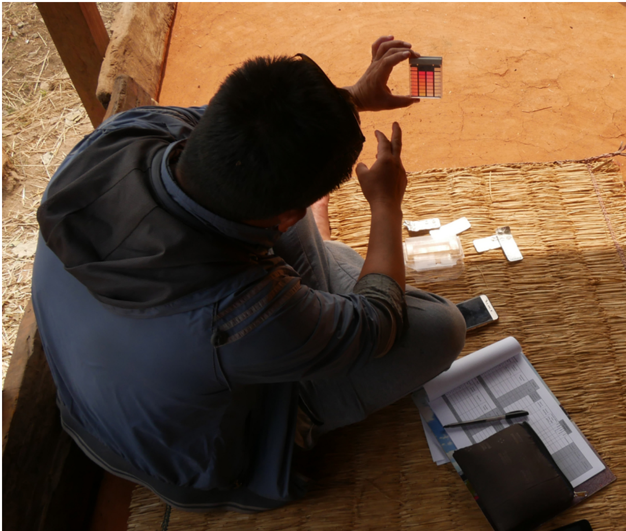
Test der Trinkwasserqualität in Nepal: Bestimmung von Chlorgehalt und pH-Wert