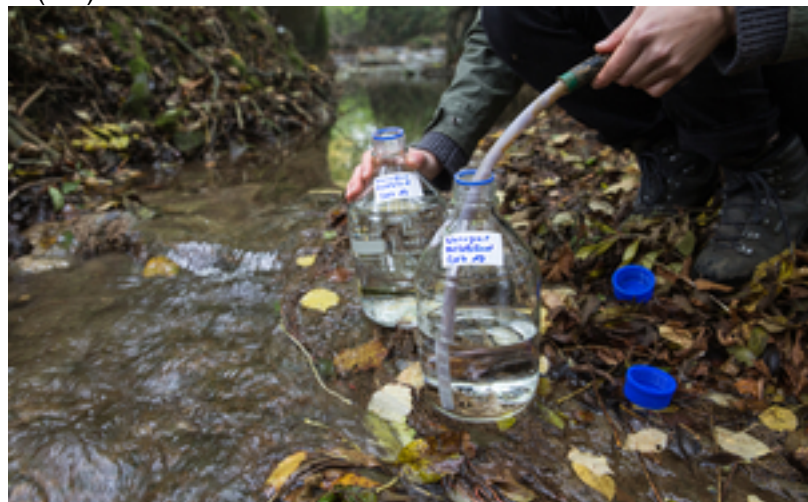
Probenahmen am Eschelisbach (TG)