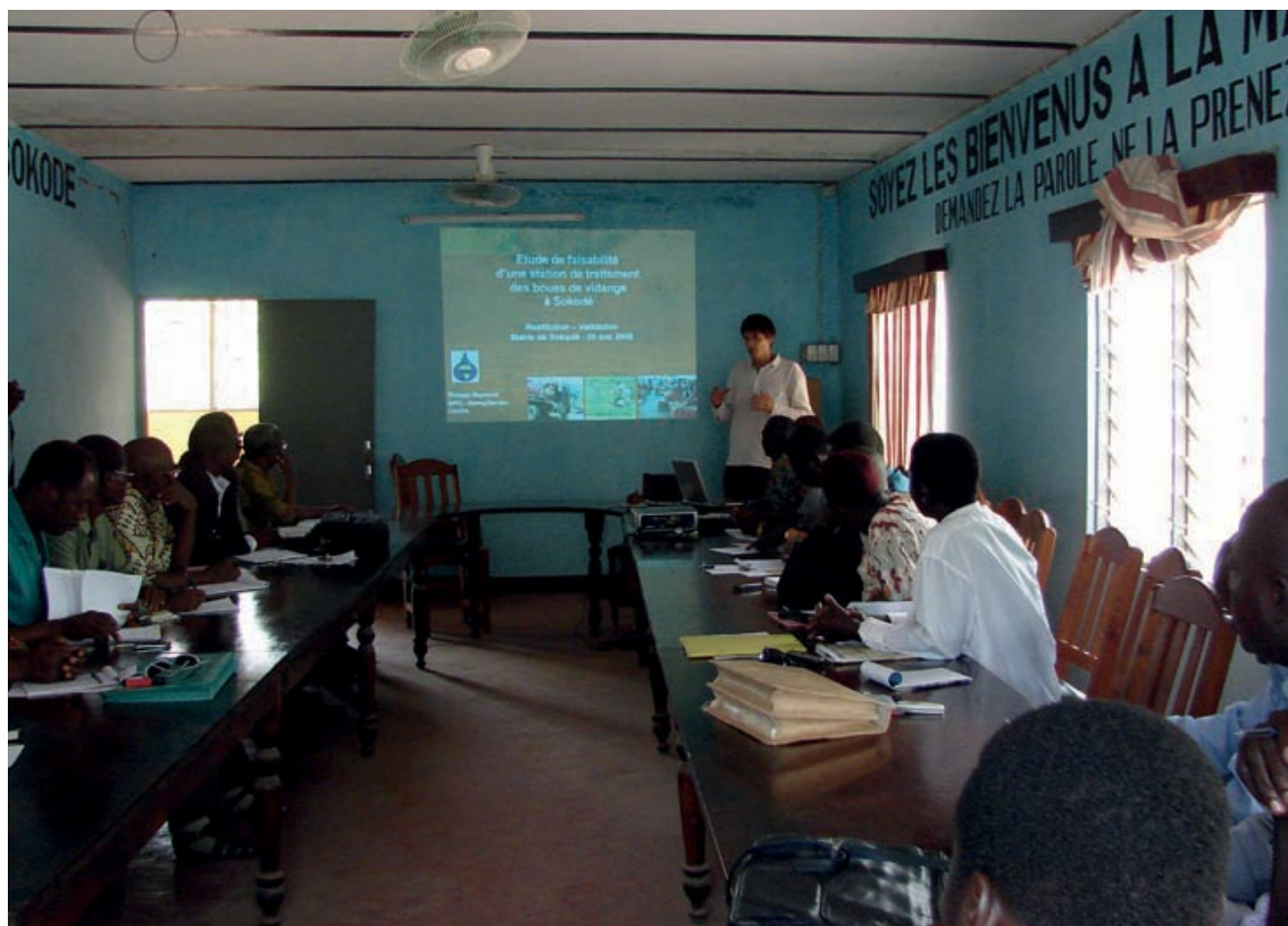
Figura 16.1 Taller en la alcaldía de Sokodé, Togo, con todos los actores en el saneamiento de la ciudad.

En la planificación del MLF, es frecuente encontrar conflictos de interés y de objetivos entre los actores. Por ejemplo, los operadores privados de recolección y transporte quieren minimizar la distancia hasta el sitio de descarga, mientras las autoridades municipales podrían querer ubicar la estación de tratamiento de LF (ETLF) lejos de la ciudad (Sección 15.5.4). Para una implementación exitosa, las partes involucradas deben aprender