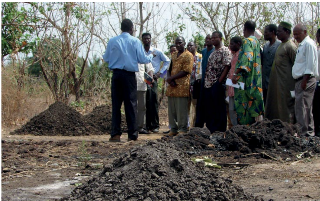
Figura 16.2 Salida de campo a un sitio de descarga informal en Sokodé, Togo.

Promoción y cabildeo: El objetivo de esta técnica es asegurar que se tomen en cuenta durante la planificación los intereses de los grupos menos organizados, privilegiados o comunicativos. Estos grupos reciben consejos y sus intereses son manifestados en los comités respectivos u otros organismos, por sus representantes o por los líderes del proceso. Es una forma de empoderamiento y consiste principalmente en convencer y persuadir a los otros actores. Por ejemplo, puede ser para convencer a las autoridades o a los servicios públicos de los beneficios de un enfoque integrado.