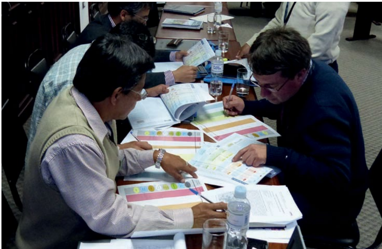
Figura 16.6 Sesión de capacitación sobre sistemas de saneamiento en el Ecuador.

Una vez que se haya seleccionado las alternativas técnicas y los modos organizativos, las responsabilidades deben ser distribuidas y formalizadas. Esta determinación es parte del desarrollo del Plan de Acción (Sección 17.4.3, Tabla 17.1). Debe aplicarse cuidado especial para evitar que haya traslape entre las responsabilidades de diferentes actores (Capítulo 11). Una definición precisa de las actividades, condiciones y sanciones es necesaria para cada componente de la cadena de servicio.