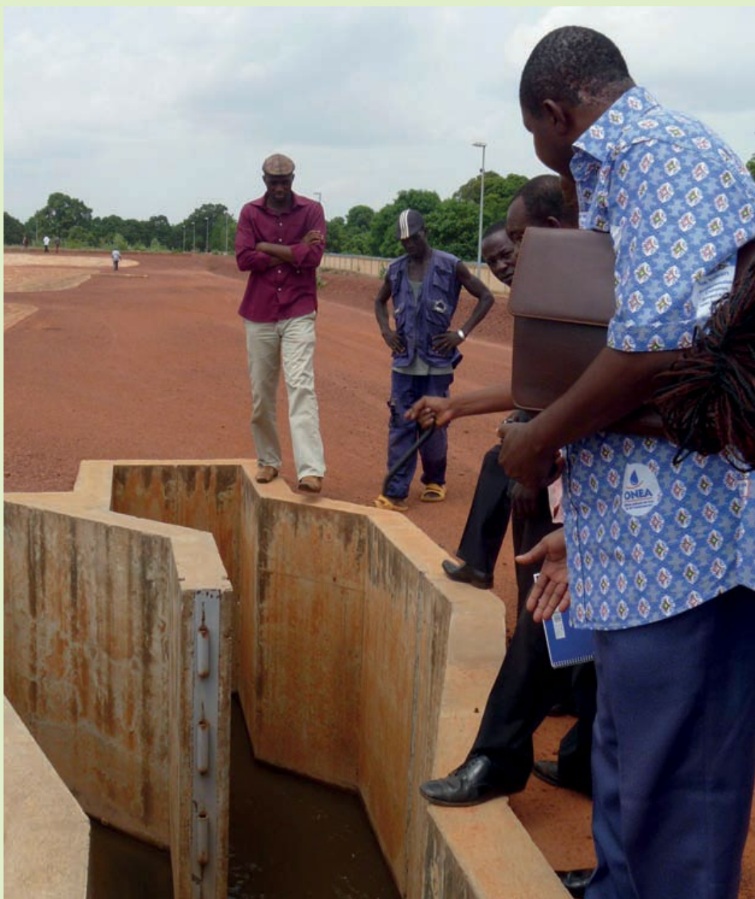
Figura 16.8 Los actores inspeccionan el punto de entrada de los lodos en una nueva estación de tratamiento de lodos fecales en Burkina Faso.

El cuadro de participación de los actores, que se desarrolló retrospectivamente con la finalidad de analizarlo, está presentado en la Tabla 16.4. Resalta el desarrollo por separado de los componentes técnicos y organizativos. El proceso de planificación que se propone en el presente libro (Sección 17.3, Tabla 17.1) está incluido en la última columna para comparación. La Tabla 16.4 también presenta actividades que se realizaron tarde pero fueron muy eficientes para la integración de los actores claves (en especial, los servicios municipales y la asociación de recolección y transporte) en la determinación del esquema organizativo y los documentos regulatorios. Este proceso se inició con la información y el diálogo, para terminar con el empoderamiento y la colaboración.