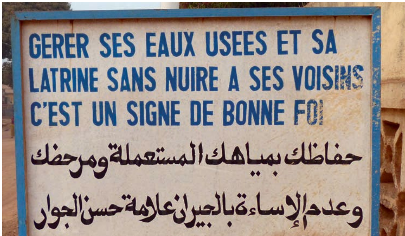
Figura 16.5 “Manejar las aguas servidas y la letrina de uno sin perjudicar a los vecinos es una señal de buena fe”, es lo que dice muy acertadamente este rótulo en la ciudad de Nzérékoré en el país africano de Guinea-Conakri (en francés y árabe).

La concientización es primordial para alcanzar un entendimiento común de los problemas existentes y para asegurar que los actores compartan los mismos objetivos (Figura 16.5). También es crucial cuando los servicios públicos o los operadores privados, que ya realizan el servicio, tengan que cambiar sus comportamientos, como estar acostumbrados a verter los lodos en el ambiente y ahora, en cambio, tener que llevarlos a la ETLF que se va construir.