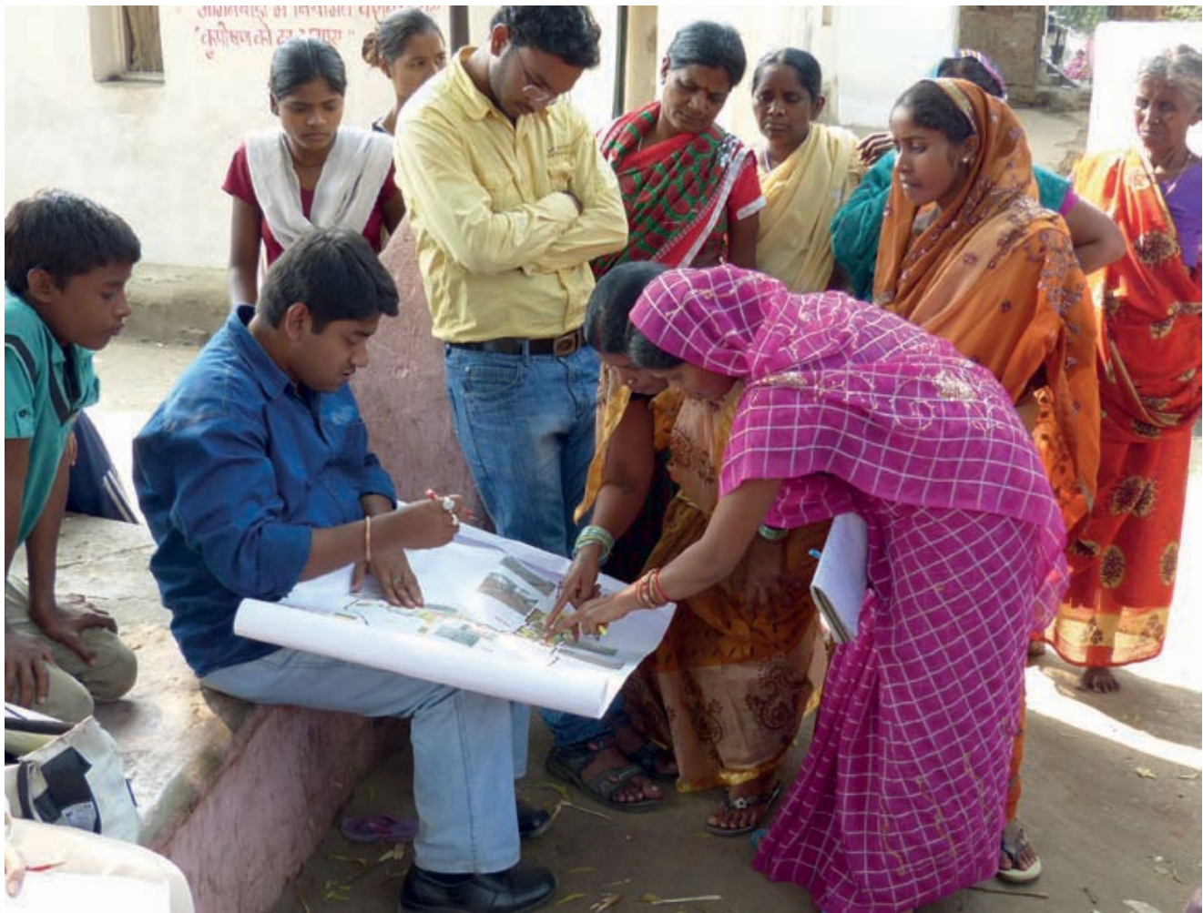
Figura 16.3 Mapeo participativo del saneamiento en la India.

Mediación: En situaciones conflictivas, la mediación a través de terceros neutrales es un esfuerzo para llegar a soluciones de mutuo acuerdo. Primero, se aclaran los asuntos claves y las áreas de conflicto, incluyendo intereses, aversiones y bloqueos. Luego, se procura encontrar maneras de resolver el conflicto que sean satisfactorias para ambas partes, mediante la evaluación de alternativas y la confirmación que sean justas.