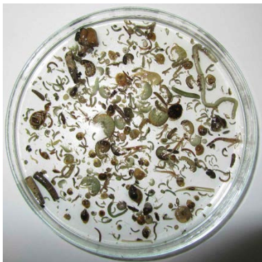
Wirbellose Kleintiere sind mit gängigen Methoden nur sehr aufwändig zu inventarisieren.

Bilder (Download ab www.eawag.ch >> Medien; honorarfreie Verwendung nur im Zusammenhang mit einer Berichterstattung zu dieser Medieninformation, keine Archivierung. Quellenangabe: Eawag.)