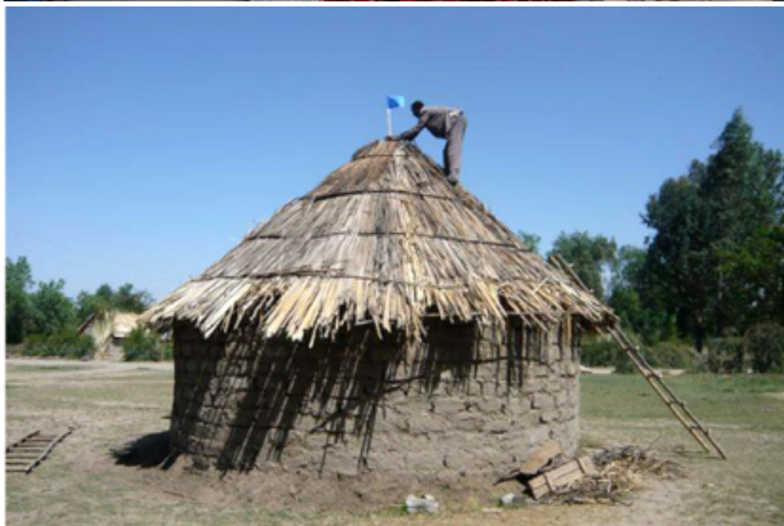
Fig. 3 : Au Bangladesh, des femmes s'engagent publiquement à ne plus tirer leur eau que de puits non contaminés à l'arsenic. En Éthiopie, cette famille signale par un drapeau son engagement à ne plus prendre d'eau de sources contaminées au fluor.