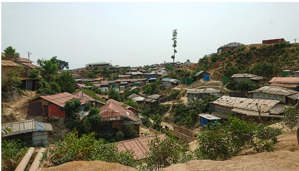
Camp de Rohingya, Cox's Bazar, Bangladesh.