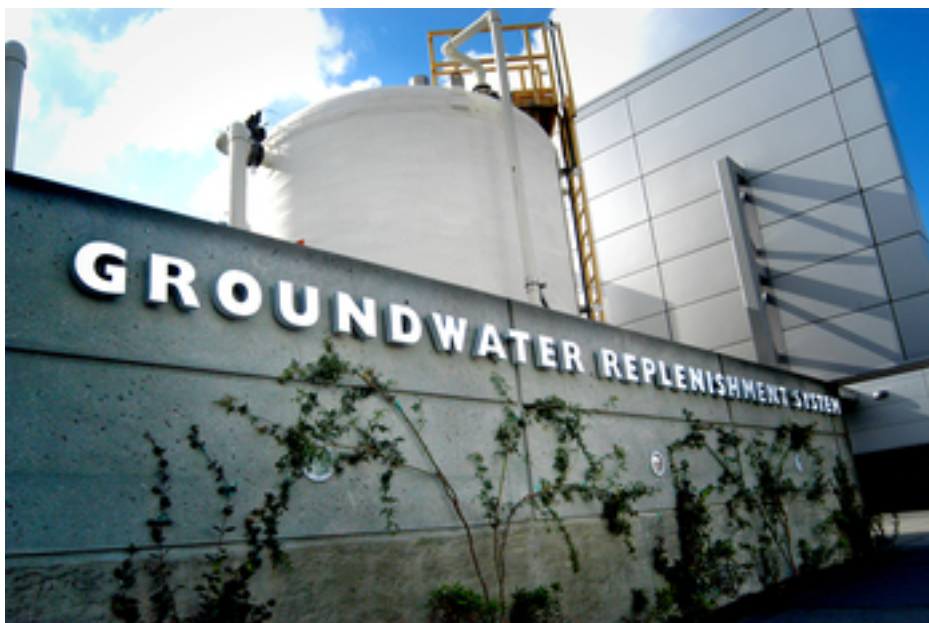
Fig. 3 : Le nom donné au système a également contribué à l'acceptation du projet de potabilisation par la population californienne.