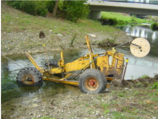
Fig. 2 : Engin spécialement conçu pour