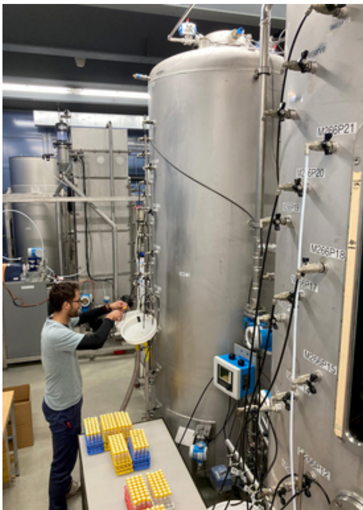
Colonne de filtration dans le laboratoire de l'Eawag (à gauche) et à l'échelle pilote dans la station de conditionnement de l'eau du lac du Service des Eaux de la ville de Zurich WVZ (à droite).