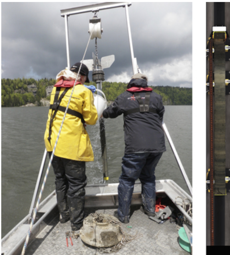
Fig. 2 : Une carotte sédimentaire est extraite du lac de Joux. Les différentes couches sont bien visibles sur la carotte JOU14-01 présentée en coupe à droite.

Ces apports ont atteint un maximum vers 1500. Avec la terre entraînée, de nombreux nutriments se sont également déversés dans le lac où ils ont stimulé la croissance algale. Les résidus retrouvés dans les sédiments en témoignent. Suite au développement des activités économiques et au recul de l'agriculture, l'érosion a commencé à régresser à partir de 1600. La composition du sédiment change alors. L'extraction du fer pourtant en plein essor à cette époque a cependant laissé peu de traces. En revanche, la rupture d'un barrage peu de temps après sa construction en 1777 a eu une forte influence sur les sédiments, les dépôts de surface étant en partie emportés par les eaux ou mélangés. Cet évènement a d'autre part causé un abaissement du niveau du lac. En complément du réchauffement progressif du climat, ce changement a conduit, au XIXe siècle, à une précipitation accrue de carbonate de calcium dans le lac. « Les couches sédimentaires datant de cette époque sont donc caractérisées par une coloration claire due à la présence de calcaire », commente Nathalie Dubois.