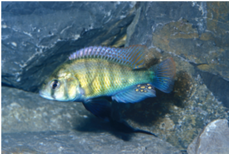
Haplochromis ishmaeli