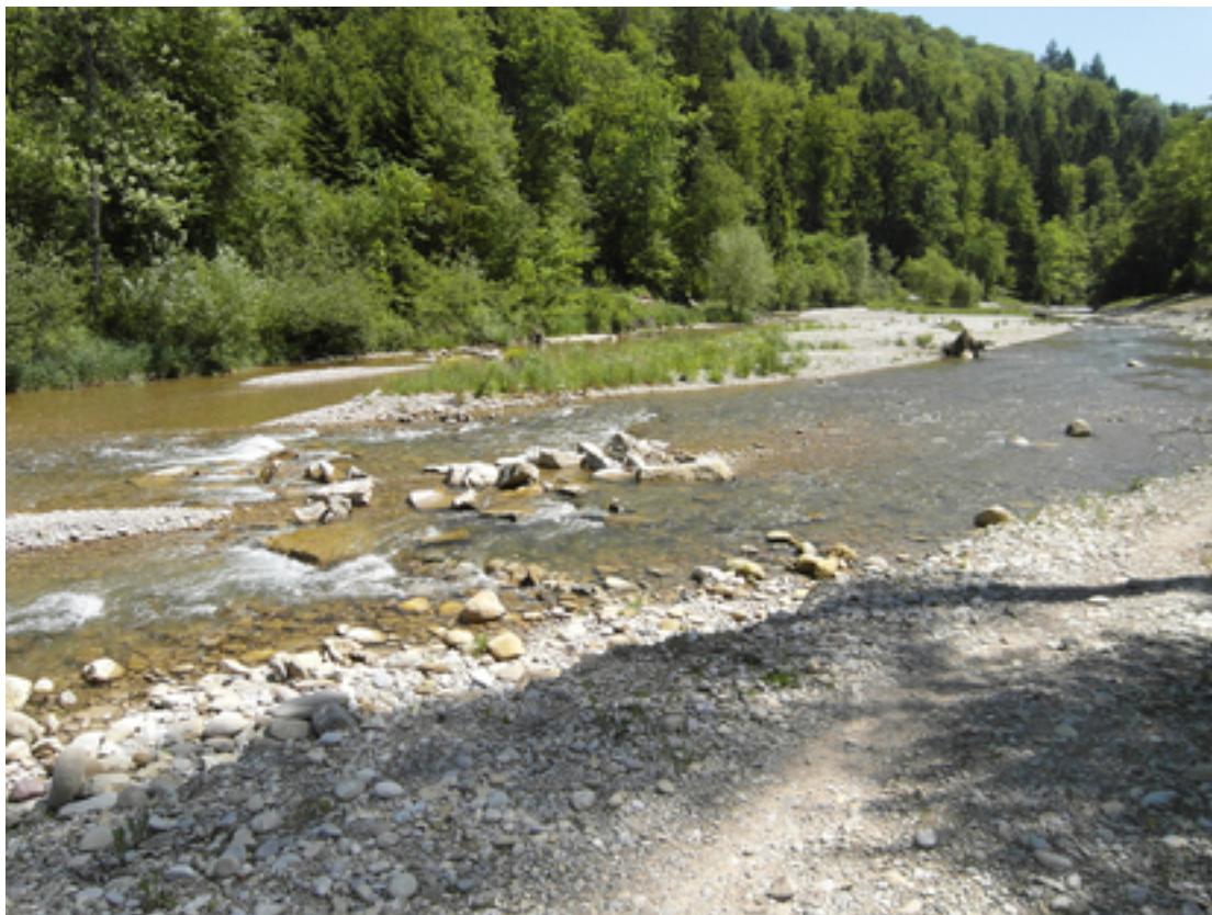
Fig. 2 : Secteurs revitalisés de la Thur (à gauche) et de la Töss (à droite).