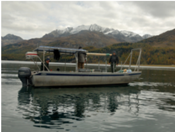
Probenahmen auf dem Silsersee.