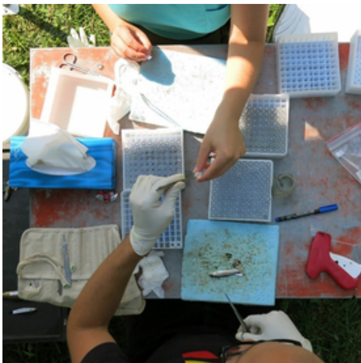
Prélèvement d'échantillons de nageoires, d'écailles et de tissus musculaires pour la collection de référence (Eawag)