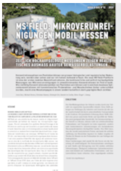
Mikroverunreinigungen mobil messen mit MS2field;