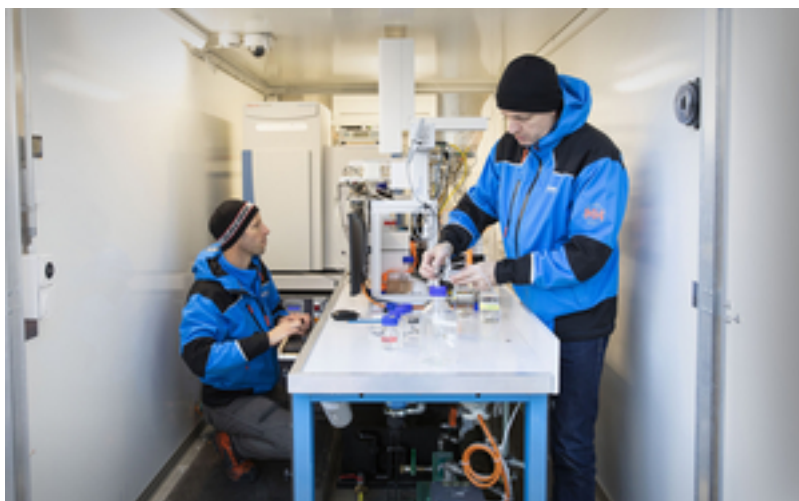
Coup d'œil à l'intérieur de la remorque de mesure.