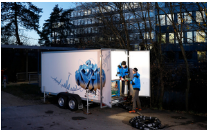
Le laboratoire mobile d'analyse de l'eau de la Chriesbach devant l'Eawag à Dübendorf.

sous-estimés avec la méthode traditionnelle parce qu'on passe à côté ou qu'ils sont dilués. L'exemple de l'insecticide thiaclopride a également révélé que les pics de concentration à court terme sont écotoxicologiquement significatifs : Ainsi, le critère de qualité ancré dans l'ordonnance sur la protection des eaux et qui vise à empêcher des préjudices considérables aux organismes aquatiques, a été dépassé plusieurs fois et de beaucoup (jusqu'à 30 fois). Pour un grand nombre de pesticides, les concentrations maximales des mesures effectuées sur 20 minutes par le MS2field ont dépassé jusqu'à 170 fois les concentrations moyennes déterminées avec les échantillons mixtes réalisés pendant 3 jours et demi.