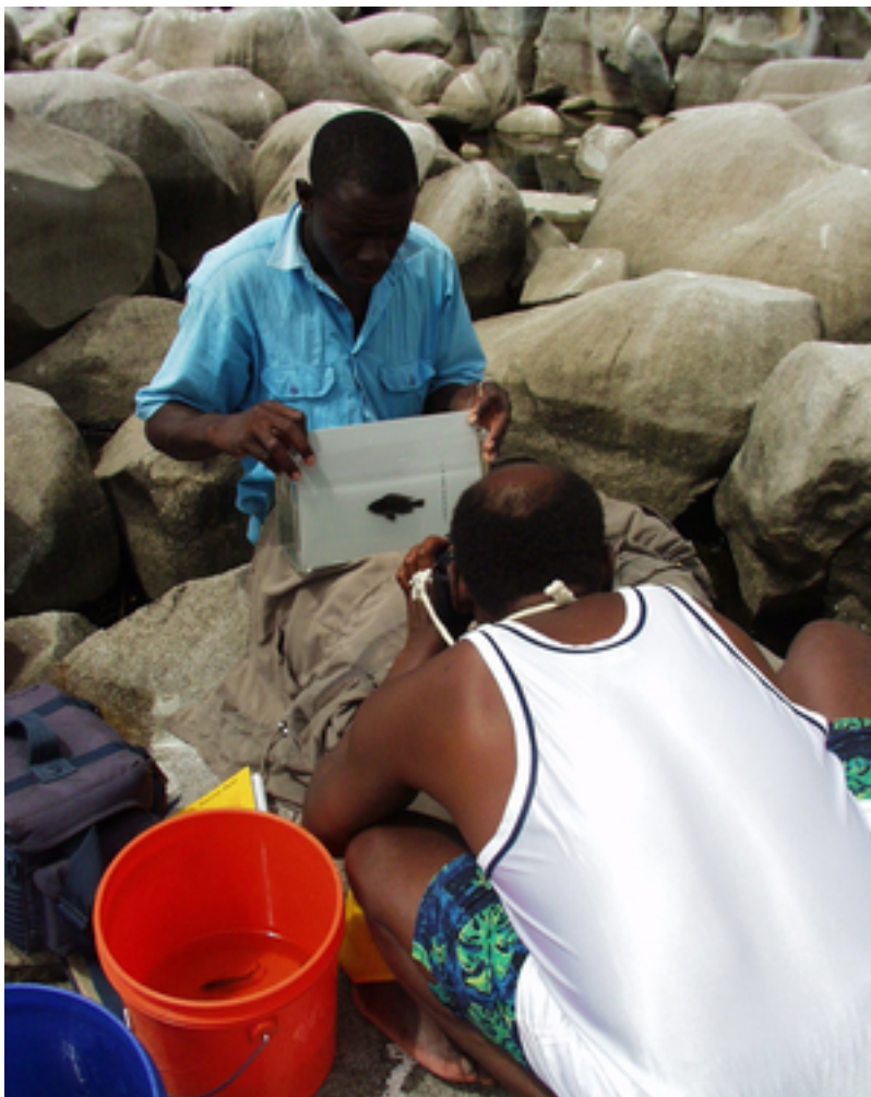
Travail de terrain au lac Victoria